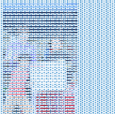
ガラガラ抽選会1等賞の液晶TV おめでとうございます！！