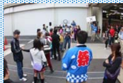
○×クイズ 分かるかな？

毎年恒例の秋祭り、楽しんで頂けたでしょうか？今回は特にイベントに力を入れたお祭りになりました。皆さんのおかげでとても盛り上がり、スタッフも楽しめました！豪華景品は持ち帰れたでしょうか！？