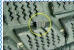
溝が有り大丈夫そうに見えますが、これが接地面まで来たら交換時期です。