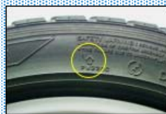
プラットフォームの位置を示す矢印

スタッドレスタイヤを履いているので雪が降っても大丈夫！…そう思っている方、ちょっとタイヤの溝を見てみましょう。スタッドレスタイヤの溝の磨耗限界を知らせるのが、タイヤの溝の中にある「プラットフォーム」です。プラットフォームは、新品時には溝と溝の間に隠れていますが、溝が磨耗するにつれ目立つようになってきます。そして、溝と同じ高さ（露出）になった時に交換のタイミングとなります（溝の磨耗が50%に達したことになります）。新品のスタッドレスタイヤの溝は、約8mm～10mmですので、「プラットフォーム」が露出した時は、約4mm～5mmと考えられます。