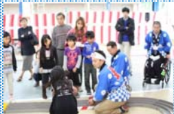
ミニ四駆は初めての子も居たのかも？